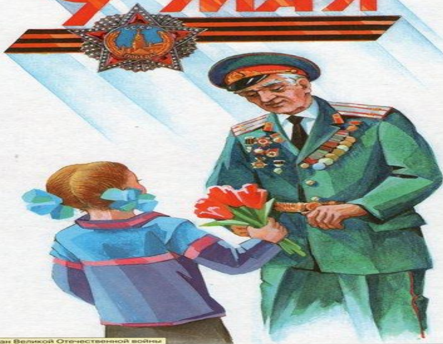
Ветеран Великой Отечественной войны