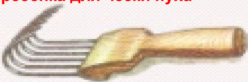
Гребёнка для чески пуха