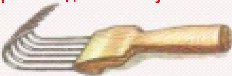
Гребёнка для чески пуха