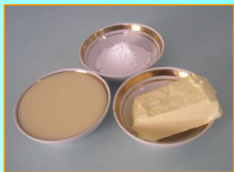
Схема приготовления крема