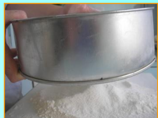
Схема приготовления песочного полуфабриката