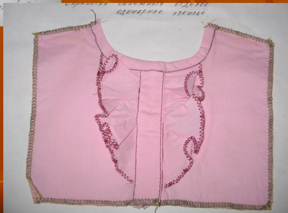
ОБРАБОТКА СВОБОДНОГО ОТДЕЛА ОДИННАРНОЕ КОКИЛЬЕ