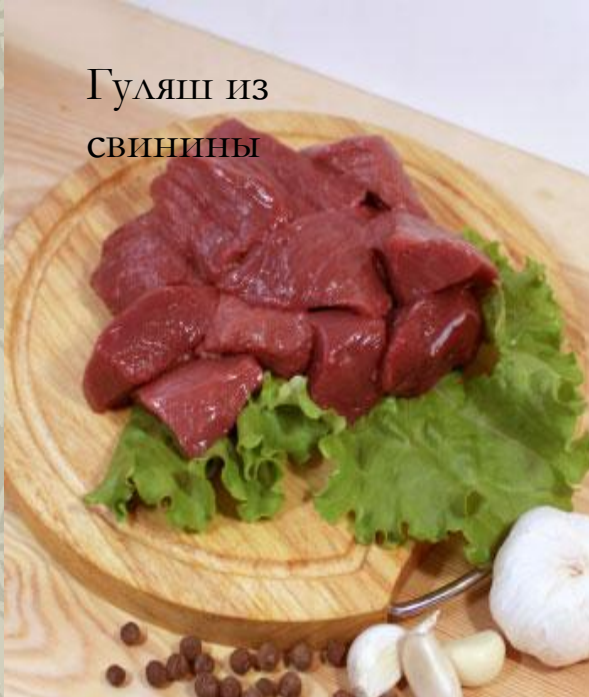
Гуляш из свинины