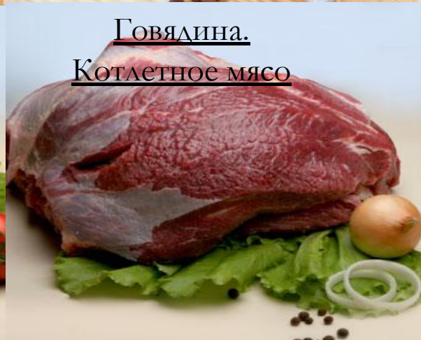
Говядина. Котлетное мясо