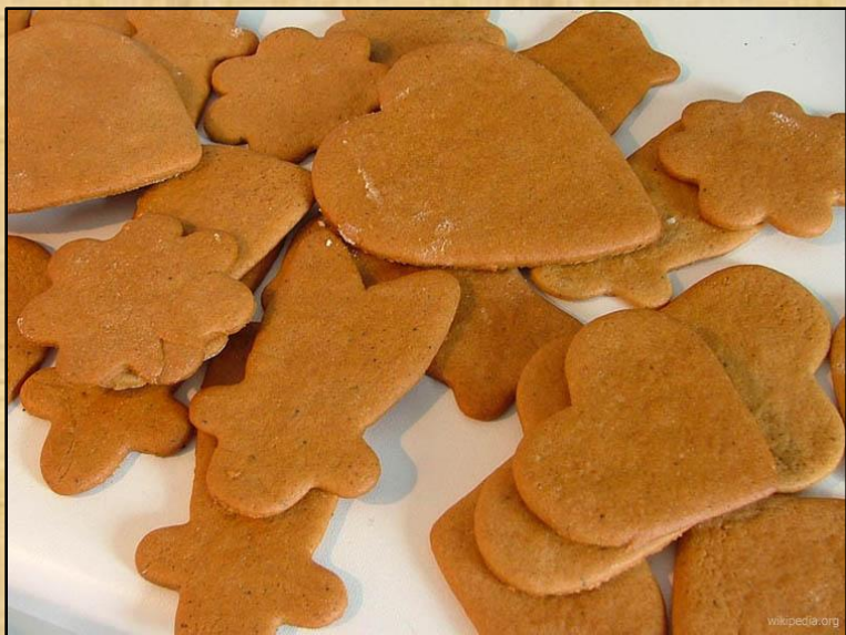
Немецкие рождественские пряники