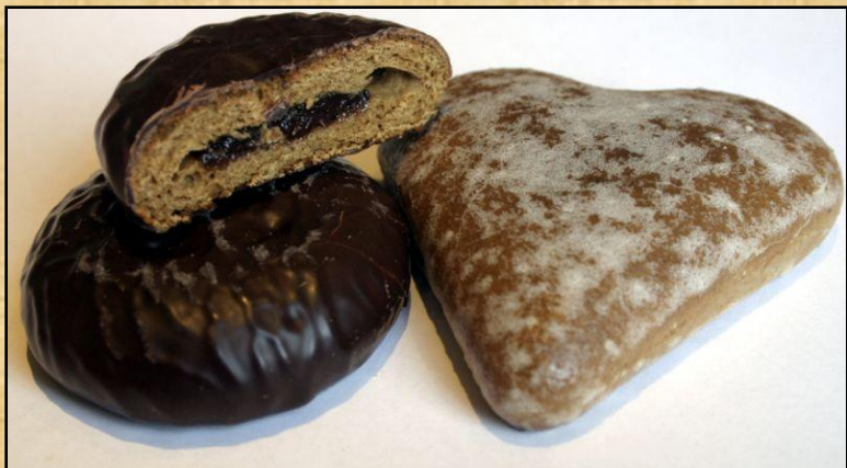
Традиционные польские пряники