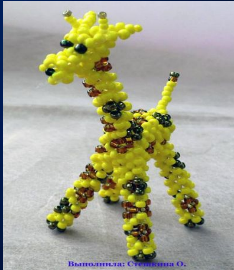
Выполнила: Степанова О.