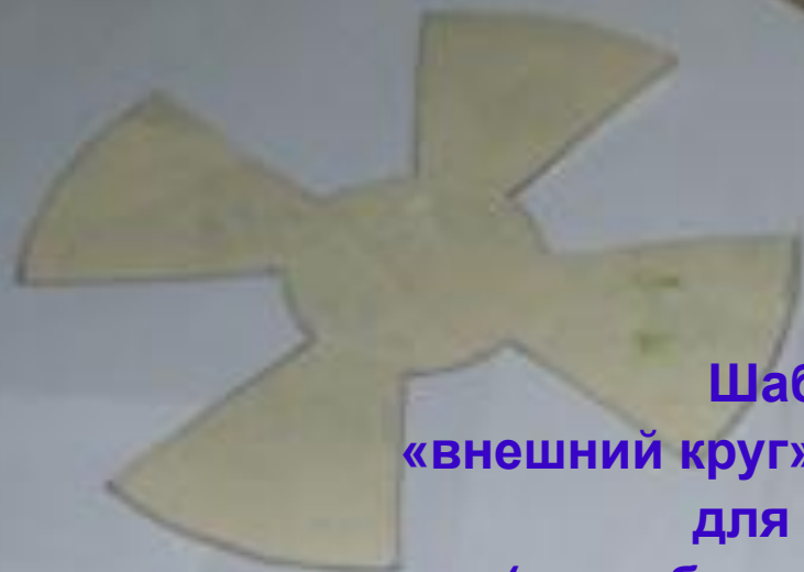
Шаблоны «внешний круг» и «внутренний круг» для цветка ( цвет бумаги по выбору)