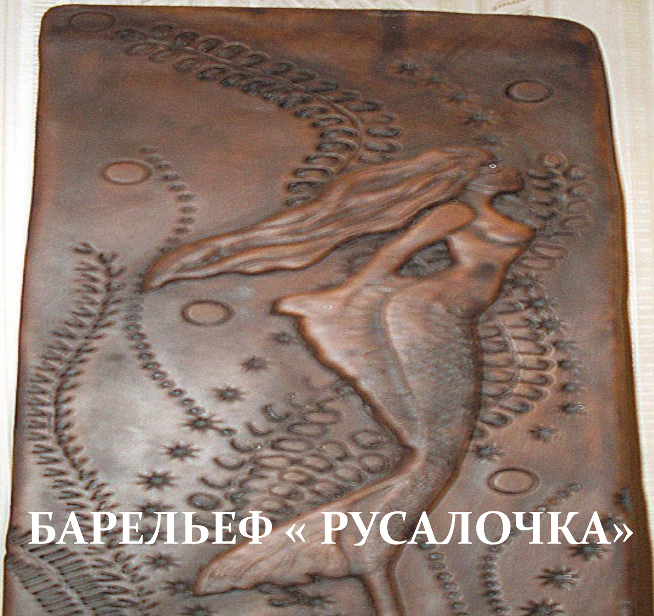
БАРЕЛЬЕФ « РУСАЛОЧКА »