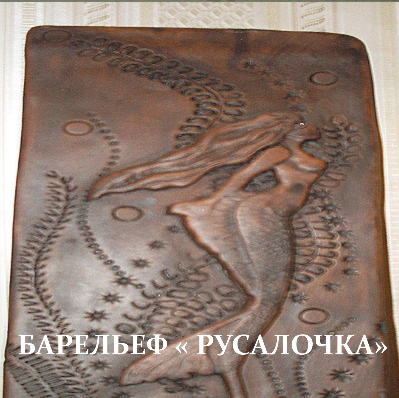
БАРЕЛЬЕФ « РУСАЛОЧКА »