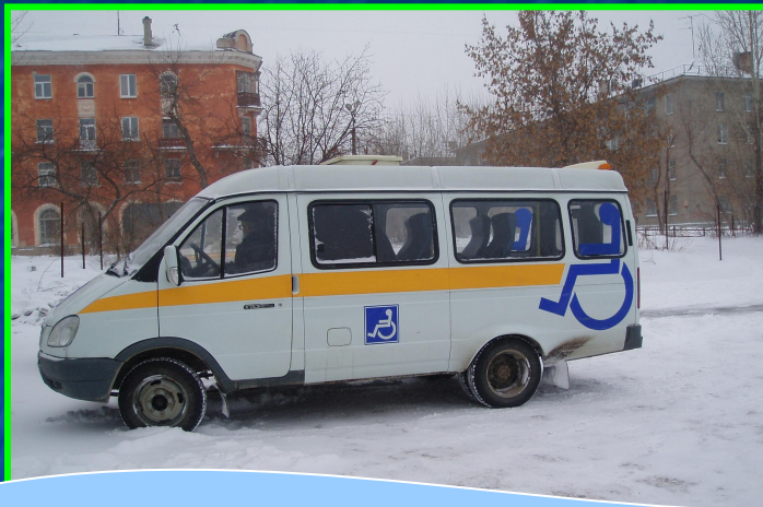
Работа службы «Социальное такси»