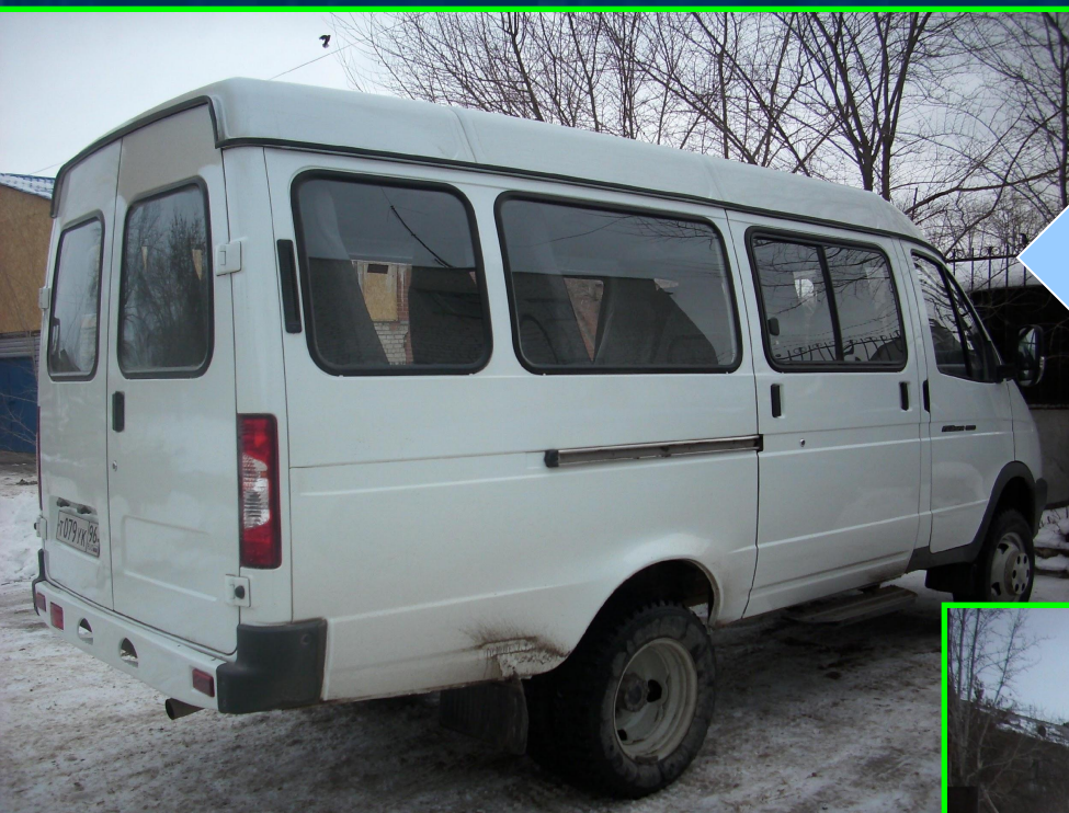
Пассажирская газель на 13 мест