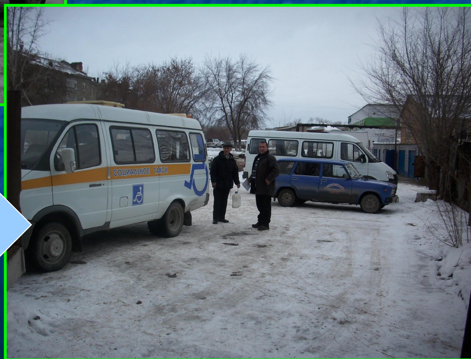
Газель с гидроподъемником для перевозки инвалидов - колясочников