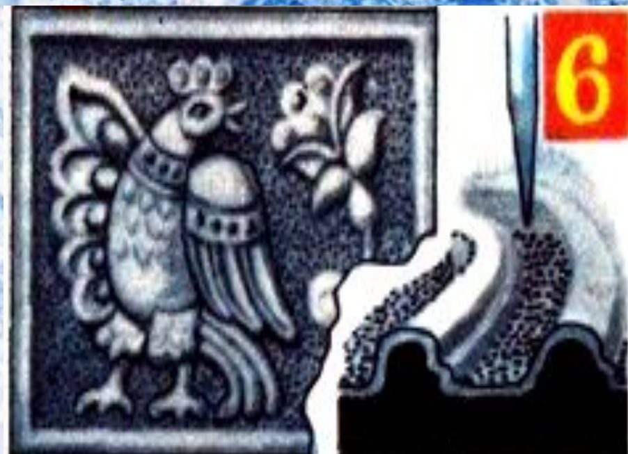
6. Отделка фона чеканом - канфарником