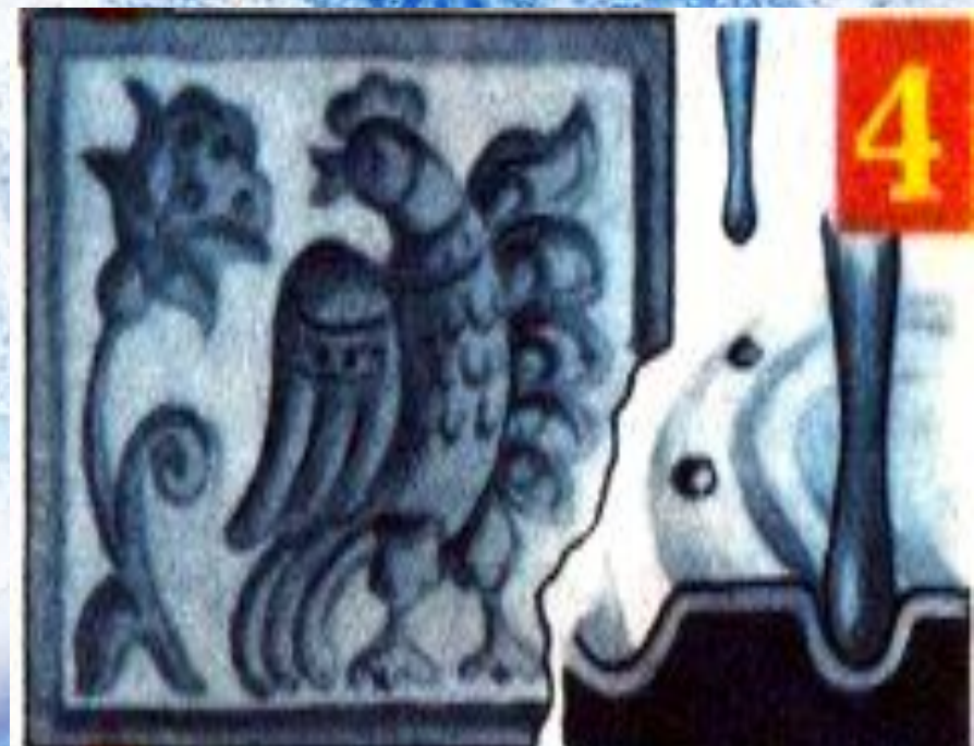
4.Создание объема чеканом- пурошником