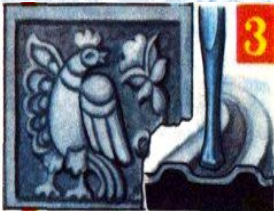
3.Опускание фона чеканом- лощатником