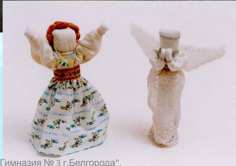
МОУ "Гимназия № 3 г.Белгорода", Дорохова Л.О., 2009г.