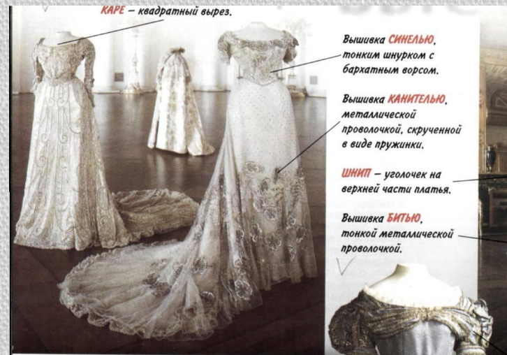
КАРЕ – квадратный вырез.

Вышивка СИНЕЛЮ , тонким шнурком с бархатным ворсом.