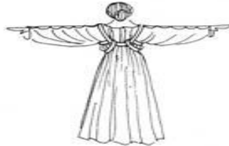
ВИД СЗАДИ Показана техника одевания хитона, изображенного на моделях 2 и 3

Источник - "Patterns for Theatrical Costumes" Перевод - Мэлфис К. (melfis_bloody@mail.ru)