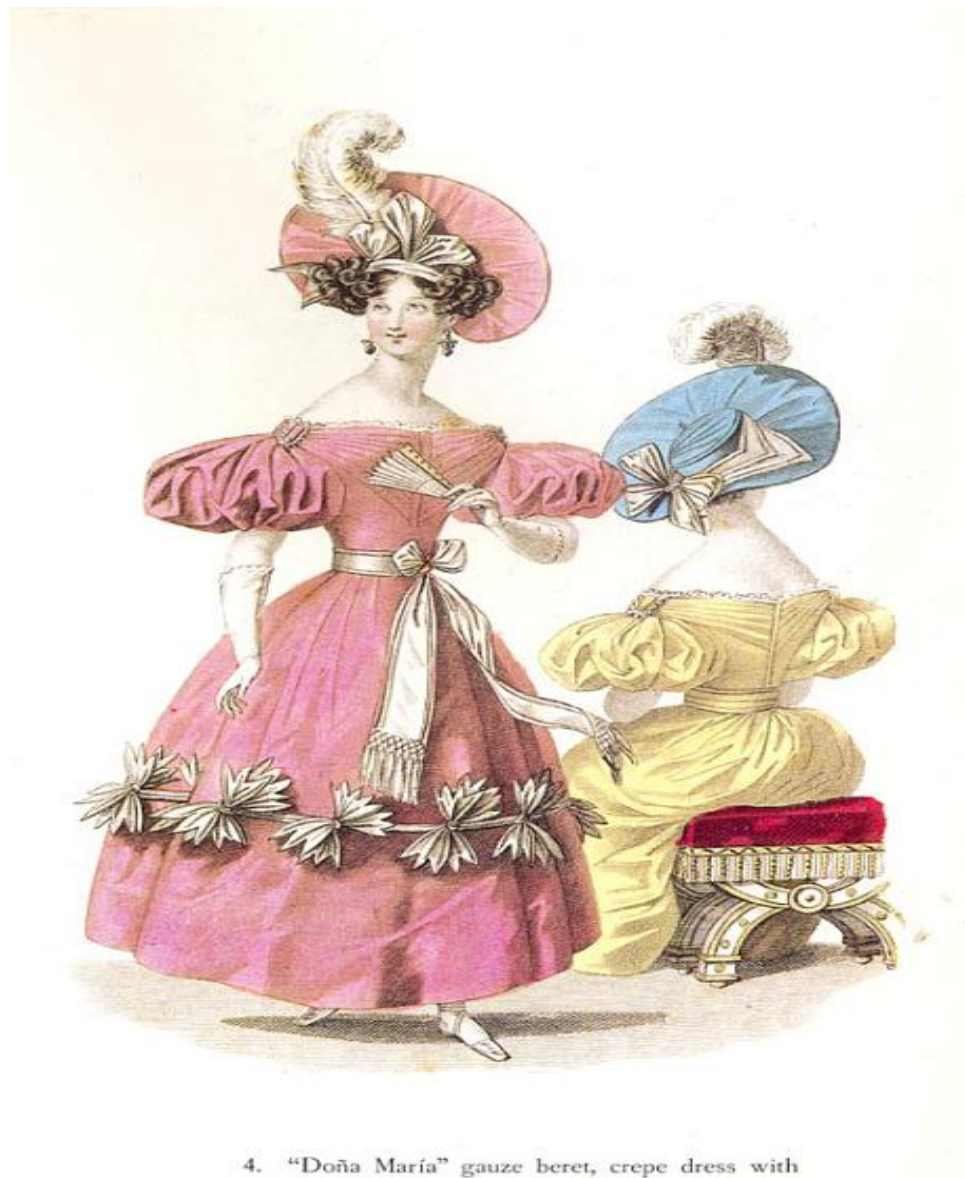
4. "Doña María" gauze beret, crepe dress with