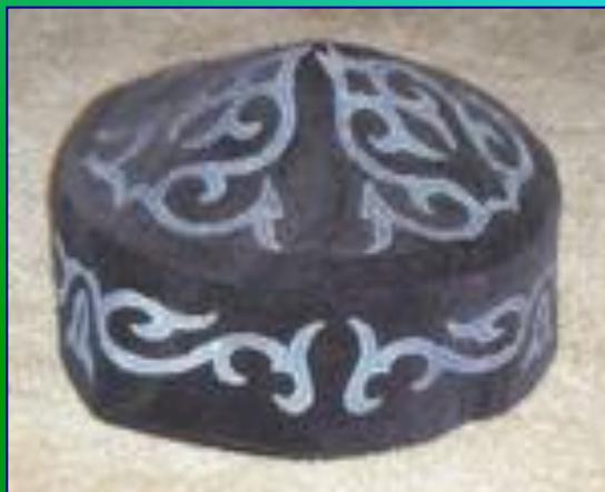
Казахская тубетейка – топы