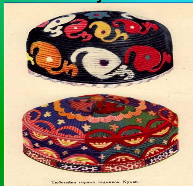
Тубетейки горных таджиков. Куляб.