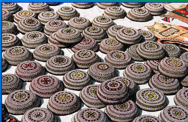
Туркменская тубетейка – тахья.