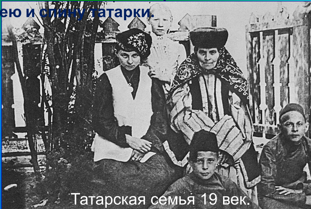
Татарская семья 19 век.

Самым распространенным девичьим убором являлся калфак . Его закрепляли на голове с помощью специальной повязки украшения ( ука-чачак ), а конусообразный конец вместе с кисточками откидывали назад или набок. У замужних женщин они были более сложные и разнообразные и, в отличие от девичьих, они обязательно должны были закрывать не только голову, но и плечи, шею и спину татарки.