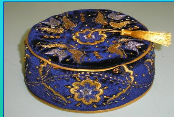
Татарская тубетейка - калыпуш.