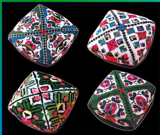
Узбекская тубетейка - дуппи или калпок.