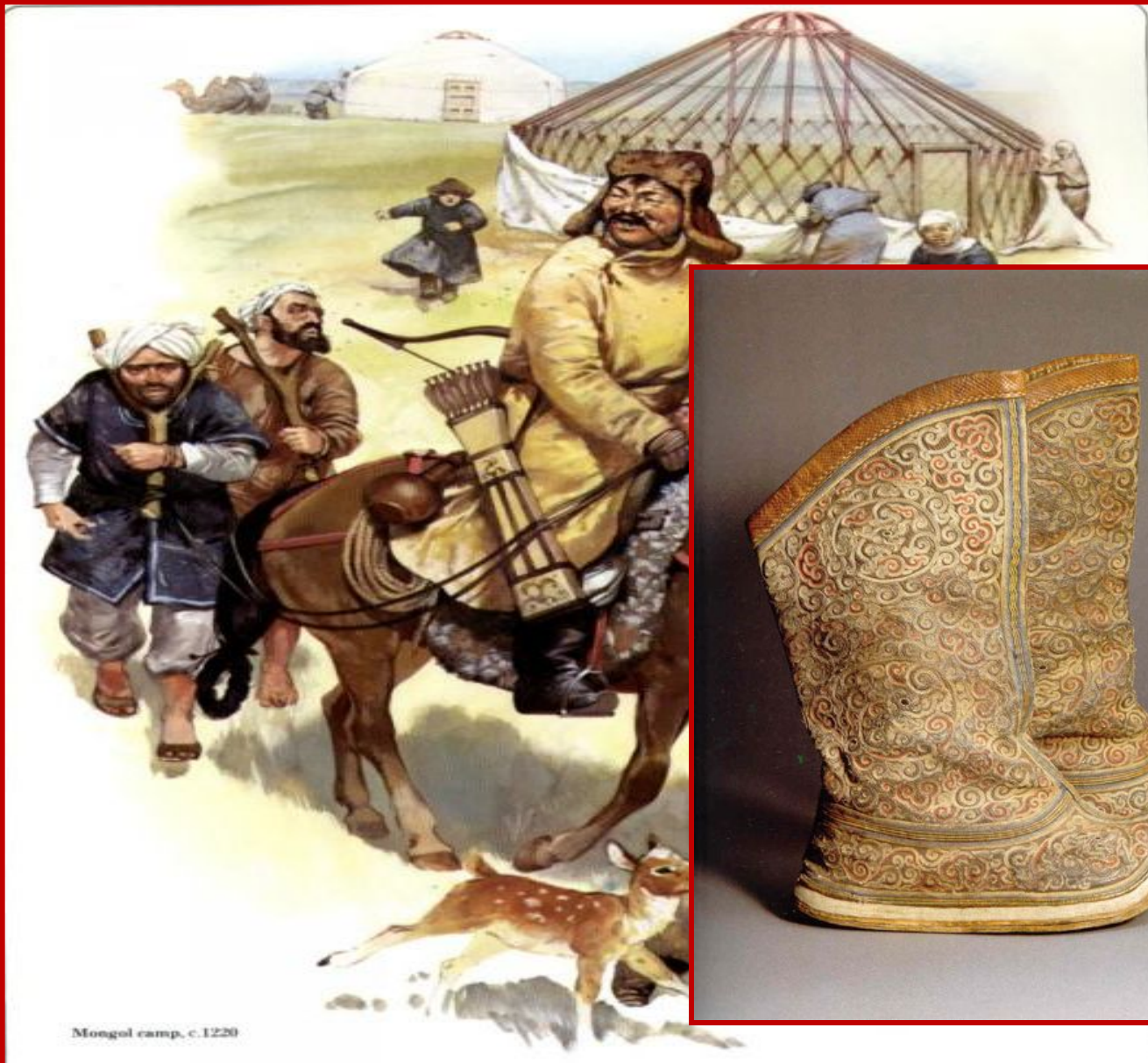
Mongol camp, c.1220