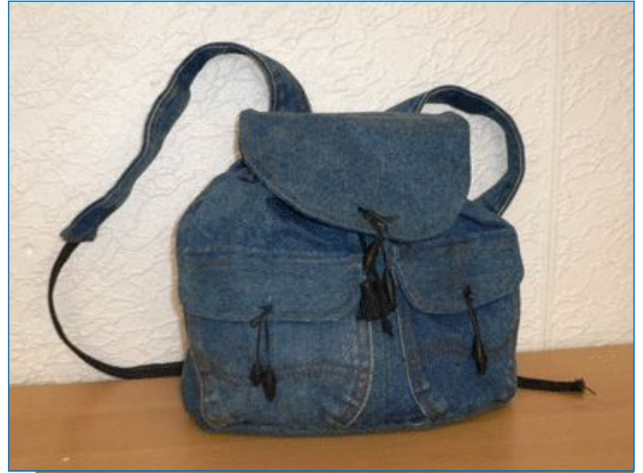
Рюкзачки с карманами