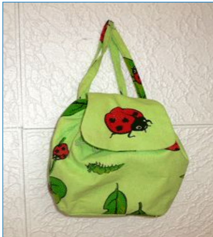
Маленький детский рюкзачок