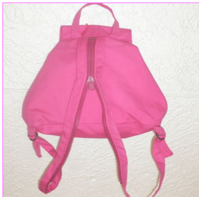
Рюкзачок с лямками, соединяющимися молнией