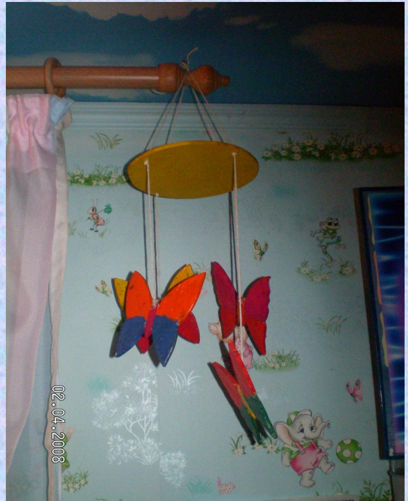
Подвеска «Летающие бабочки»