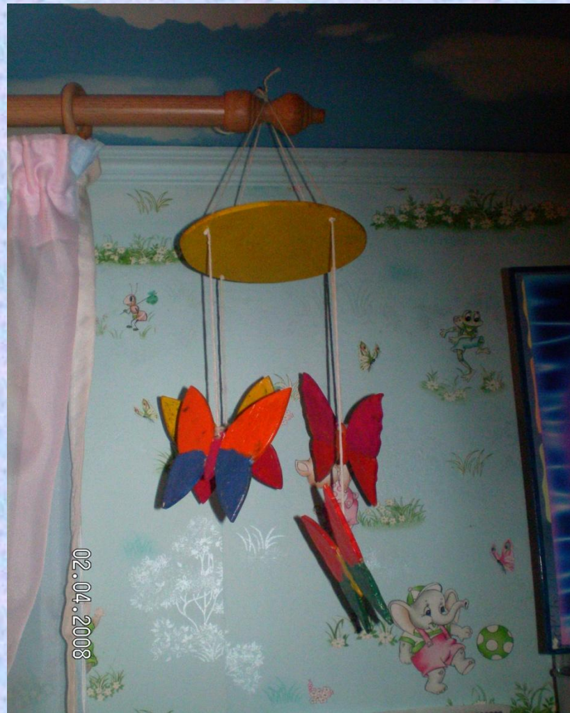
Подвеска «Летающие бабочки»