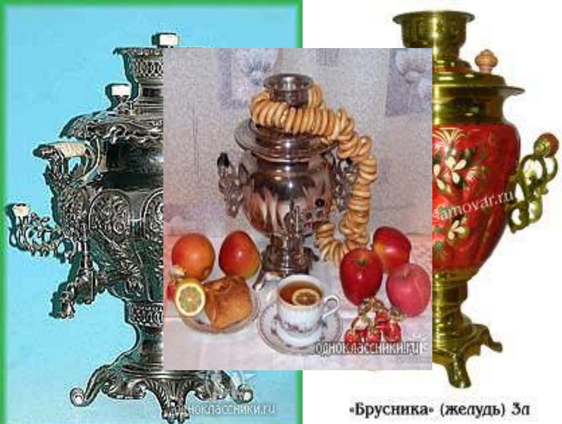
«Брусника» (желудь) 3л