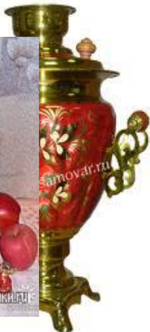
«Брусника» (желудь) 3л