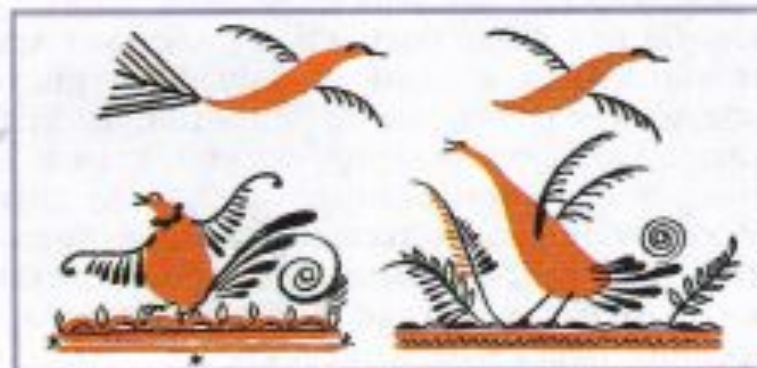
Варианты изображения коня и птицы