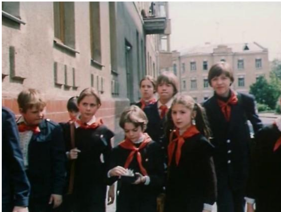
Кадр из фильма «Гостья из будущего»