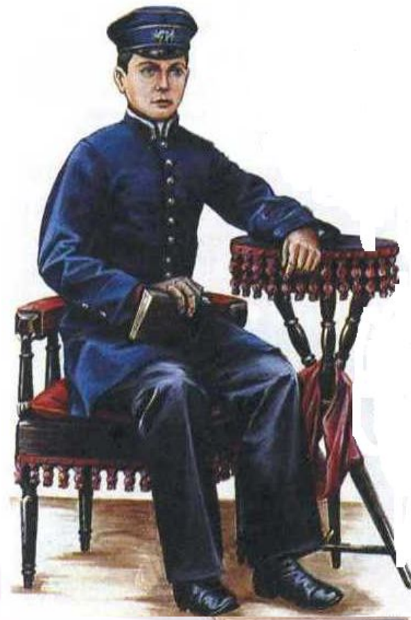
Гимназист. Конец XIX в.