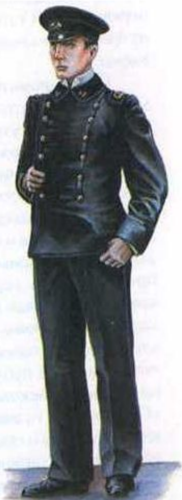
Студент Горного института. 1882 г.