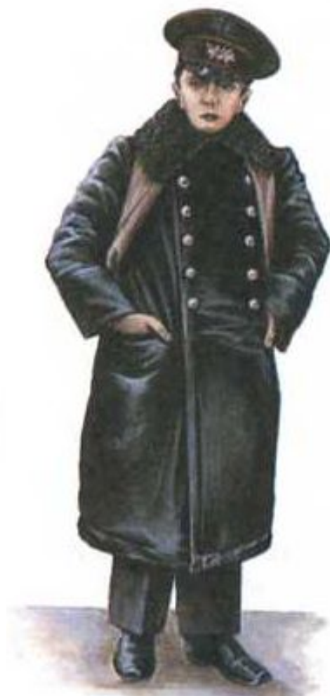
Ученик реального училища. Конец XIX в.