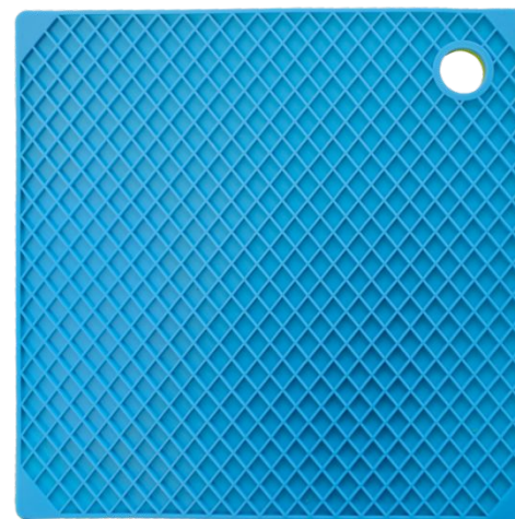
Арт. 58698 код 4130