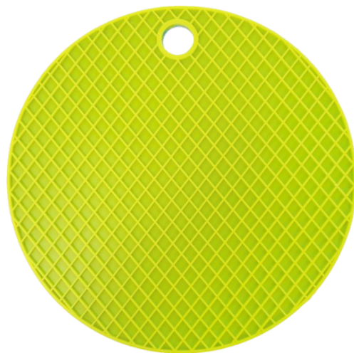
Арт. 58697 код 4129