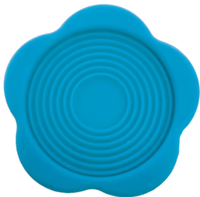
Арт. 58688 код 4131