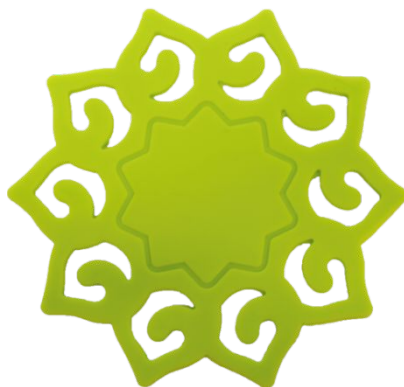
Арт. 58689 код 4132