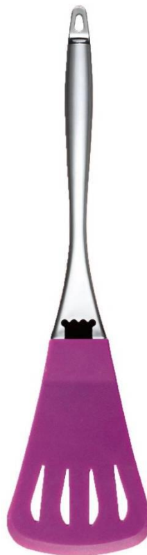
Лопатка кулинарная с отверстиями