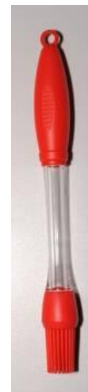
Кулинарная кисть с резервуаром