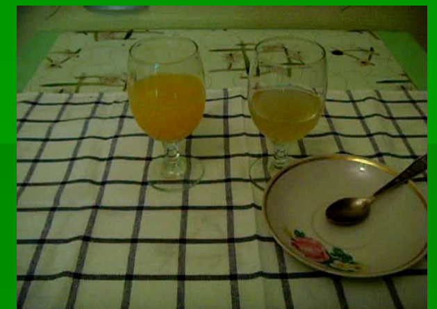
растворение желирующего продукта в сиропе