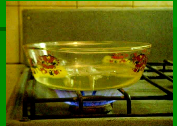
приготовление сиропа из клюквы