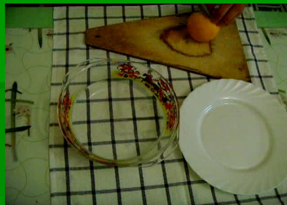
подготовка цедры для приготовления сиропа