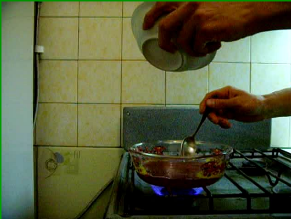
введение крахмала в сироп