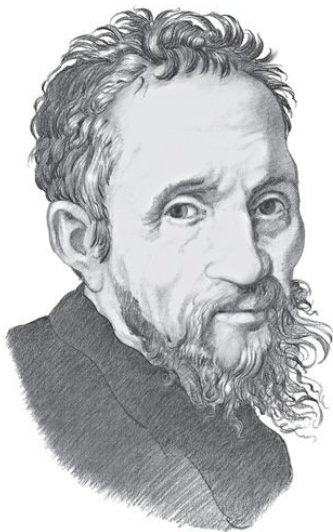
Микеланджело Буонарроти 1475—1564

Старинное предание гласит, что в конце XV века итальянский скульптор и архитектор, а еще поэт по имени Микеланджело Буонарроти впервые в жизни и в мире слепил снежную фигуру.