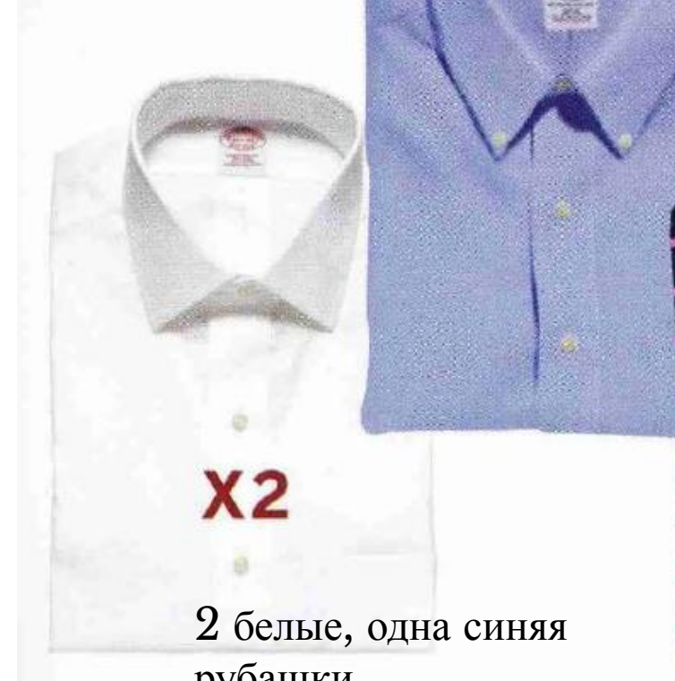
2 белые, одна синяя рубашки,