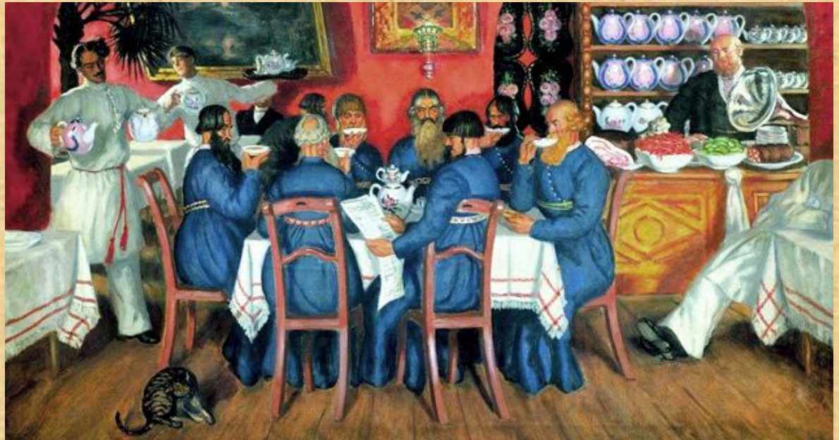
Фрагмент репродукции картины Бориса Кустодиева «Московский трактор»

В России до сих пор отдаётся дань уважения столу: у нас долго любят посидеть за трапезой. С давних пор сохраняется обычай провожать в дорогу и встречать человека застольем.