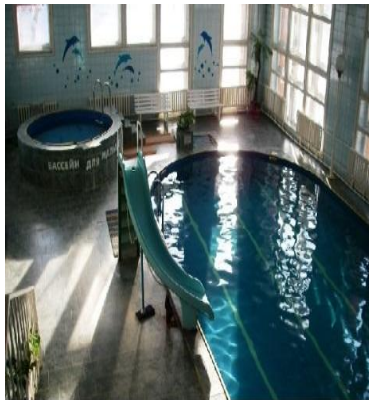
Строительство бассейна и спортивных площадок с покрытием