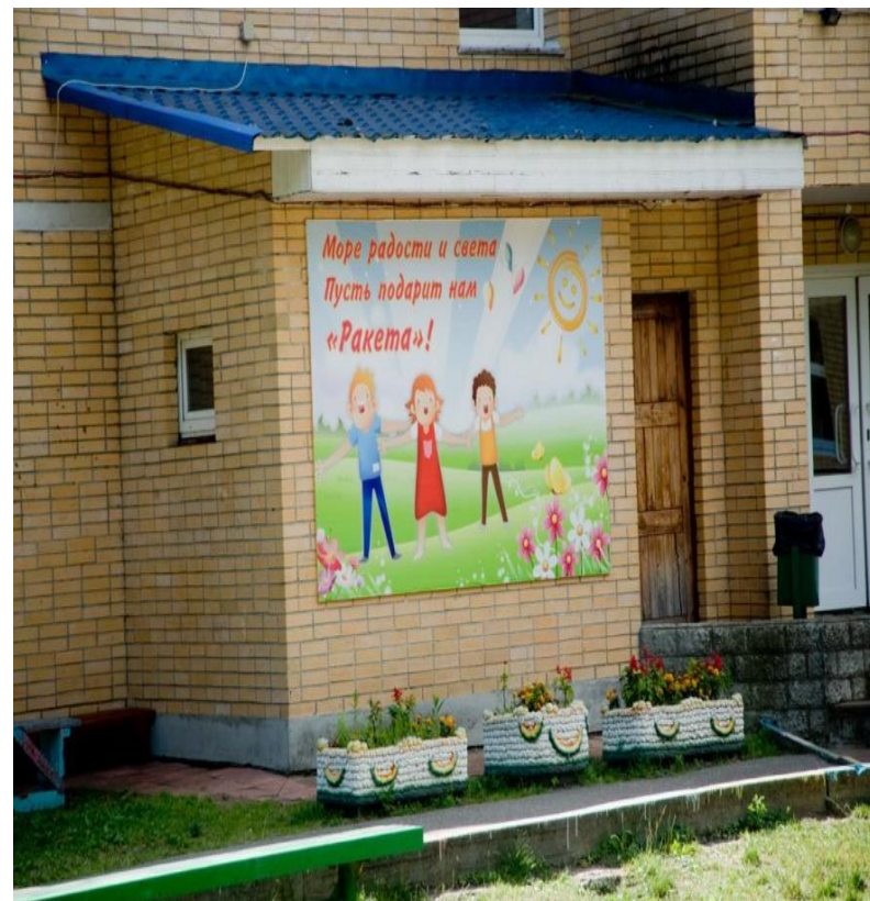
Реконструкция бассейна в п/л «Ракета»