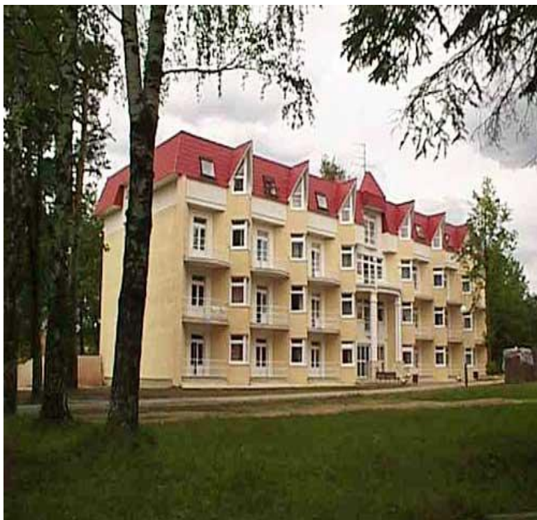
Реконструкция 3-х эт .корпуса с увеличением ширины здания с эркерами и дополнительным мансардным этажом