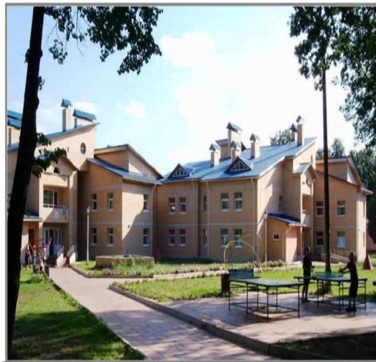
Новое строительство 2-х корпусов пионерского лагеря «Ракета»