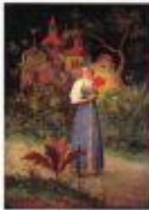
Федоскинская миниатюра мерцает изнутри волшебным светом