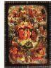
Лаковая миниатюра Хохлому украшают шкатулки, броши, зеркала, туфлячки...