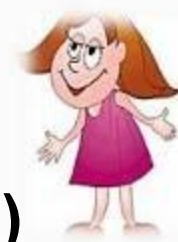
Классический стиль (деловой, офисный)