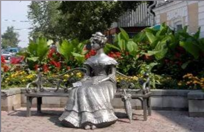
2. Статую «Люба.»