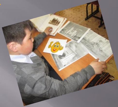
3. Памятник Слесарю Степанычу