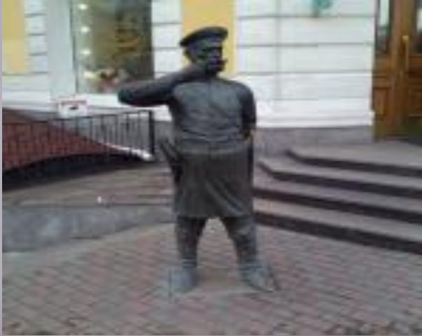
1. Памятник городовому