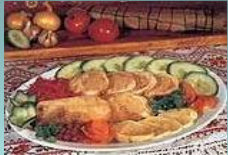
Фаршированная баранина (тутырган тэкэ).