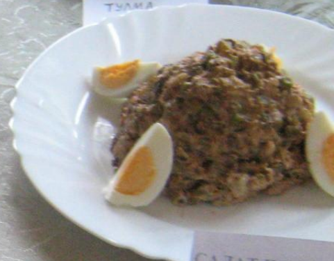
САЛАТ ПО- ДОМАШНЕМУ