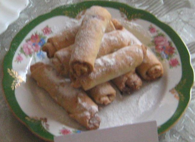
БАРМАК С ГРЕЦКИМИ ОРЕХАМИ