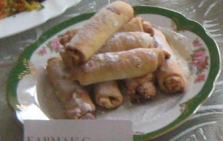
БАРМАК С ГРЕЦКИМИ ОРЕХАМИ