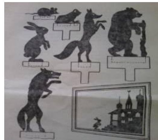
плоская картонная кукла театра теней