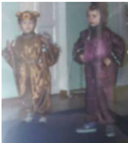
кукла-костюм для артиста