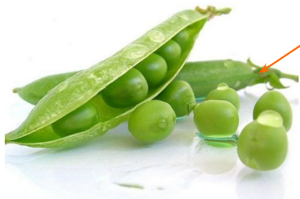
Горох, зеленый горошек