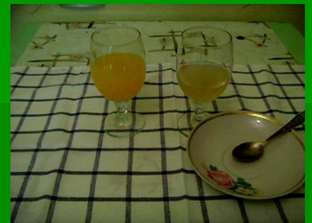
растворение желирующего продукта в сиропе