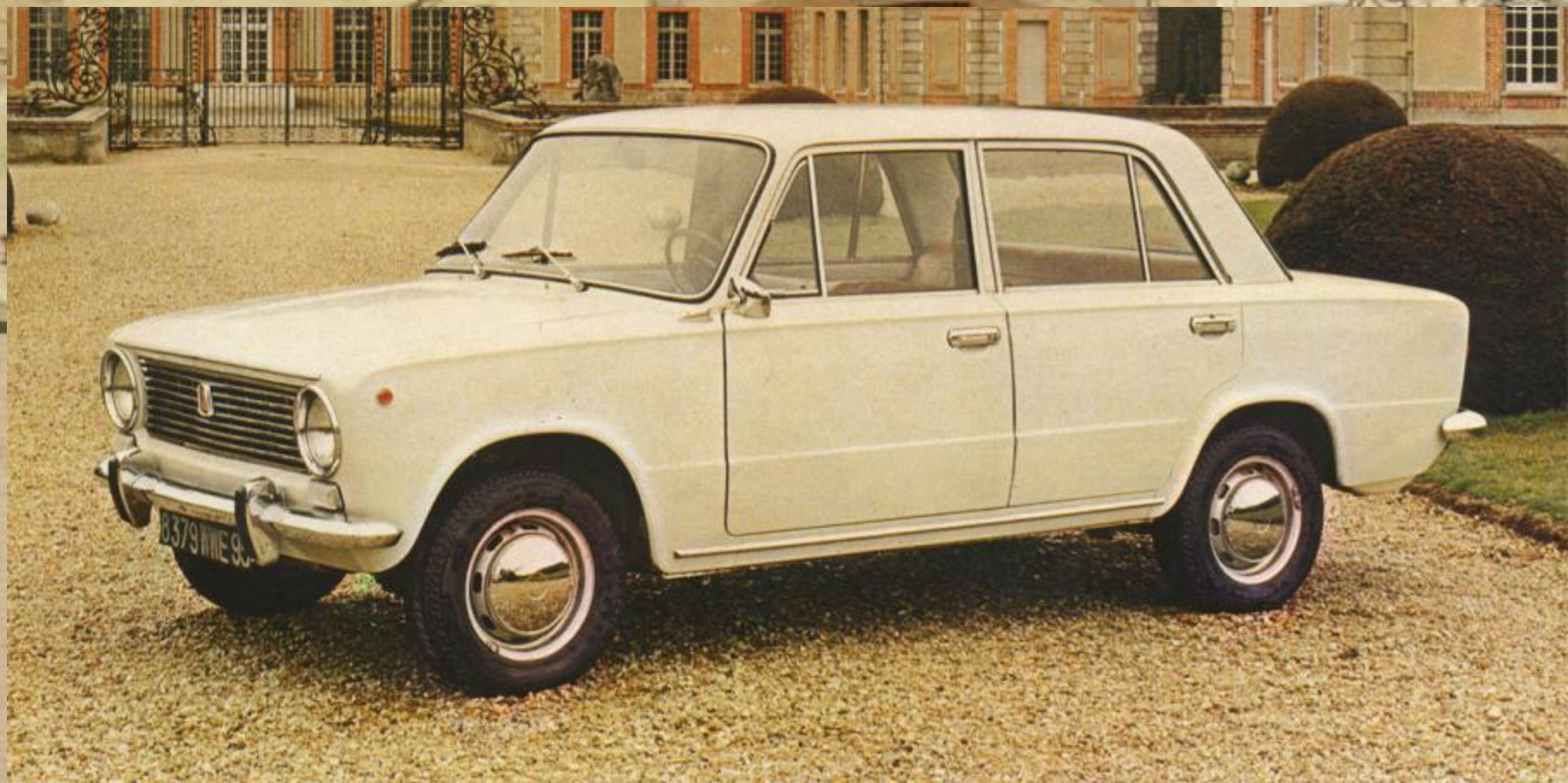
BA3- 2101 (1970 г.)