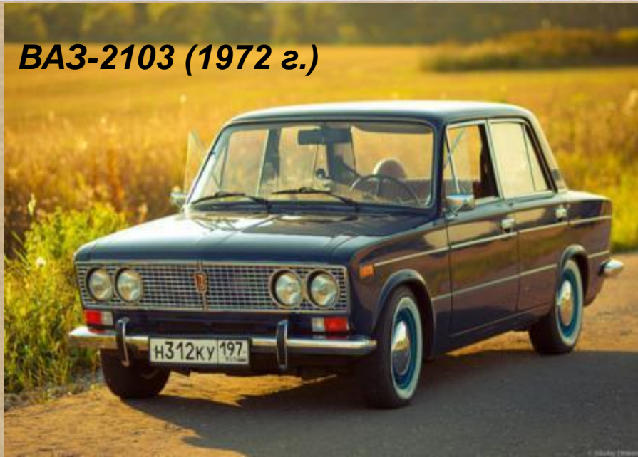
BA3-2103 (1972 г.)