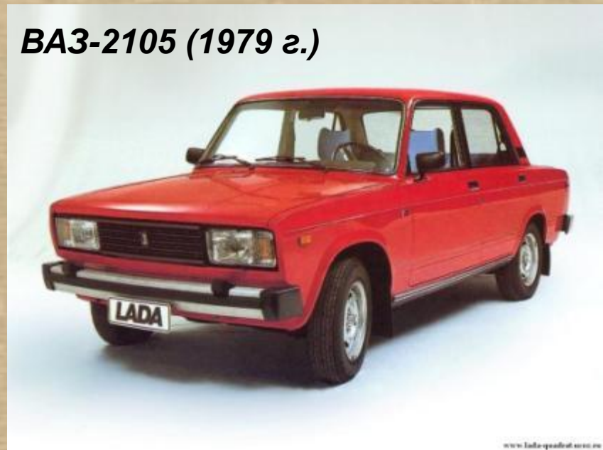
BA3-2105 (1979 г.)