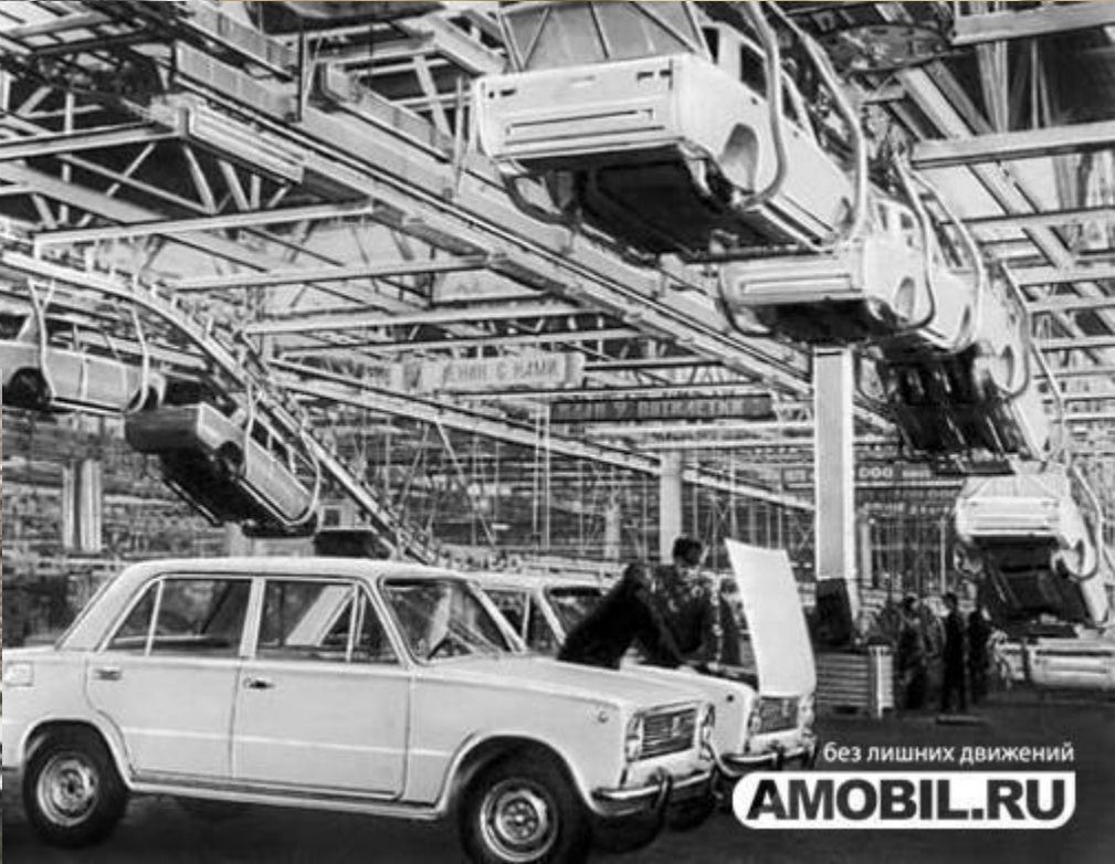
«Волжский автомобильный завод» 1966г