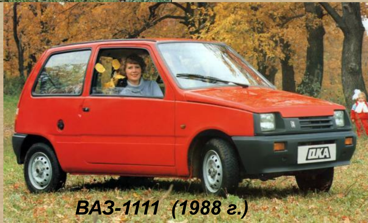
BA3-1111 (1988 г.)