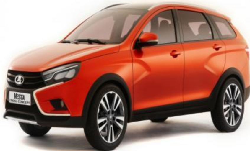
LADA- Vesta 2015 г.