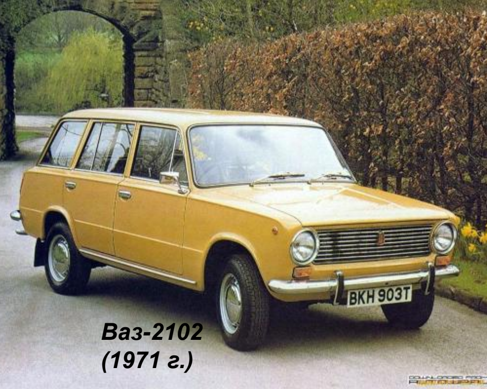
Ваз-2102 (1971 г.)