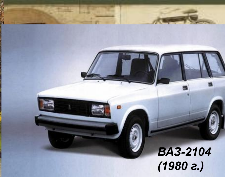
BA3-2104 (1980 г.)