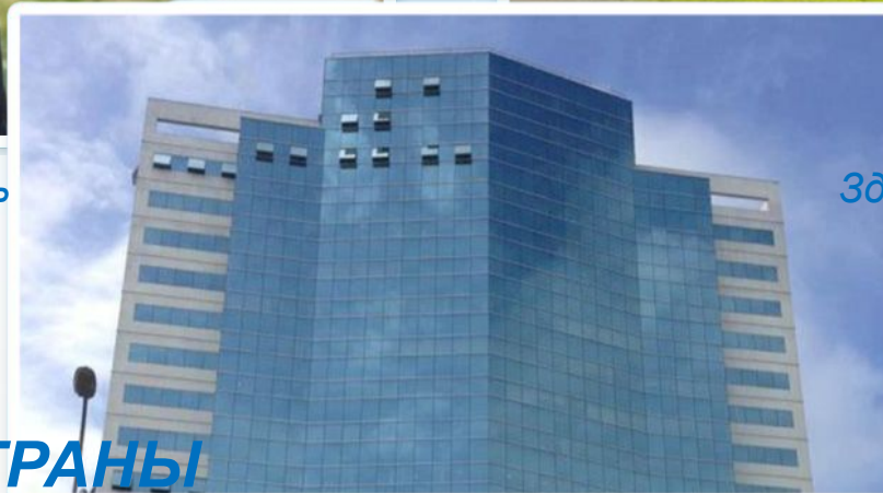
Brasil - Vitória - ES