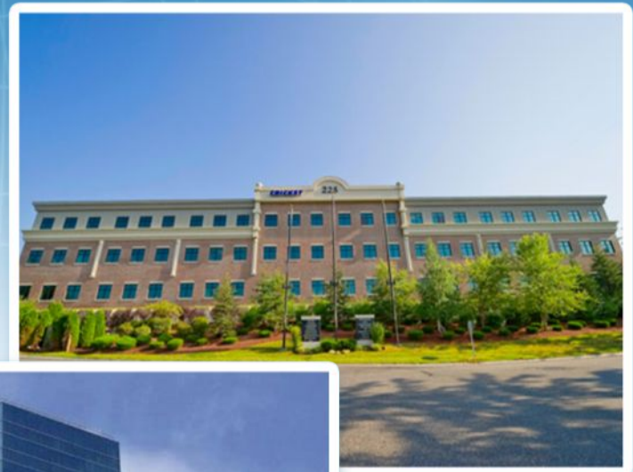
Здание TelexFREE в США Marlborough - MA