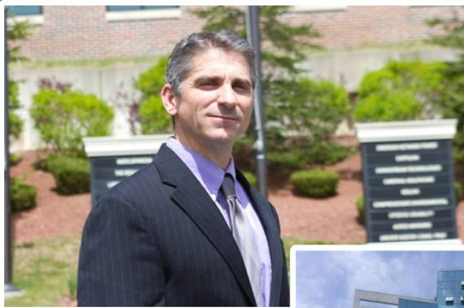
Президент и первооснователь TelexFREE