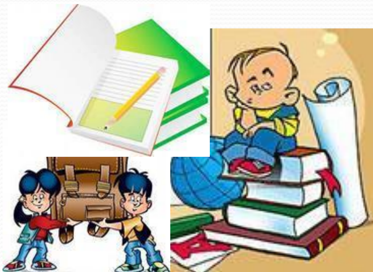
Готовность обучающихся к уроку.