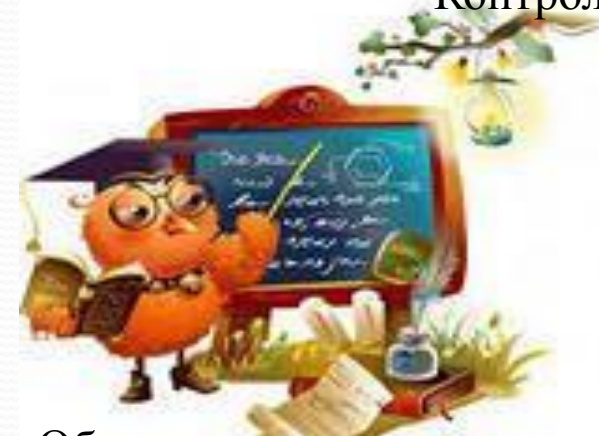
Объяснение хода и последовательности проведения занятия.