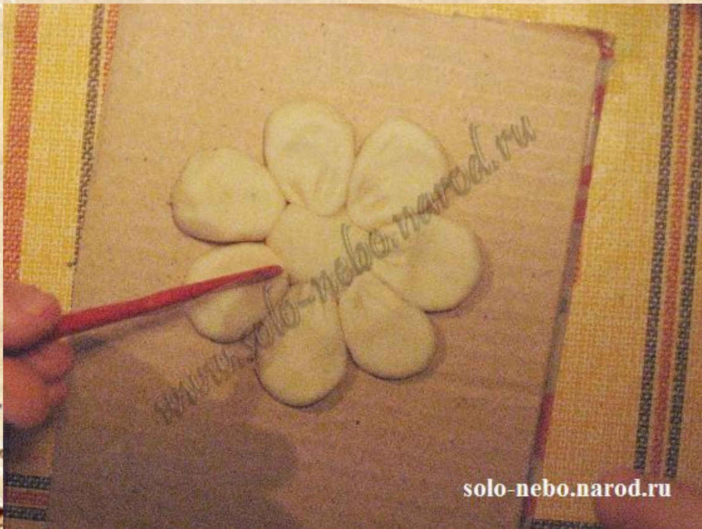
Рисунок на листиках. Обычным стеклом продавливаем полосочки от центра цветка.