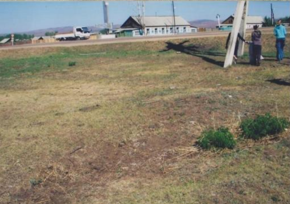
Перекресток села Новый Заган