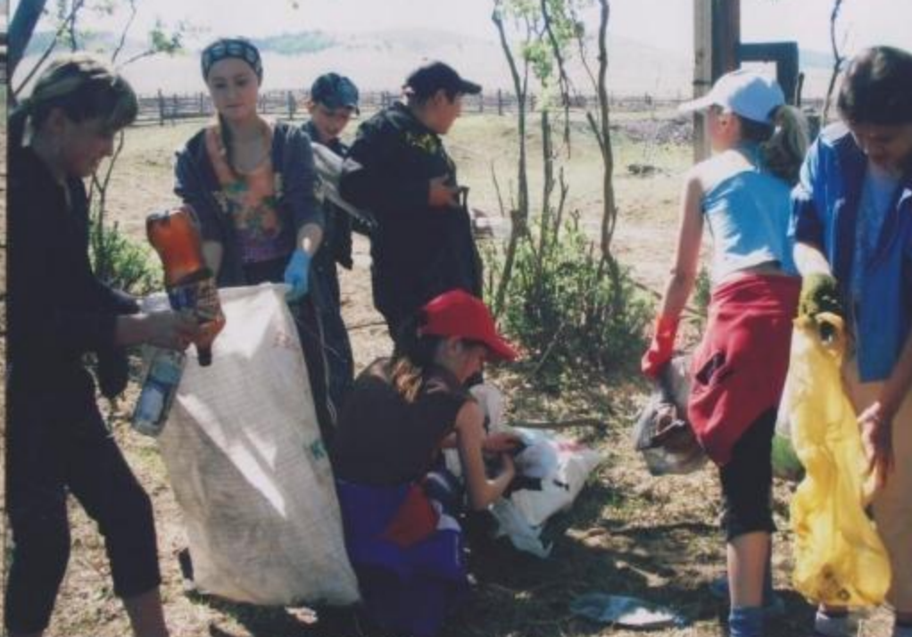
Очистка территории школьной кочегарки