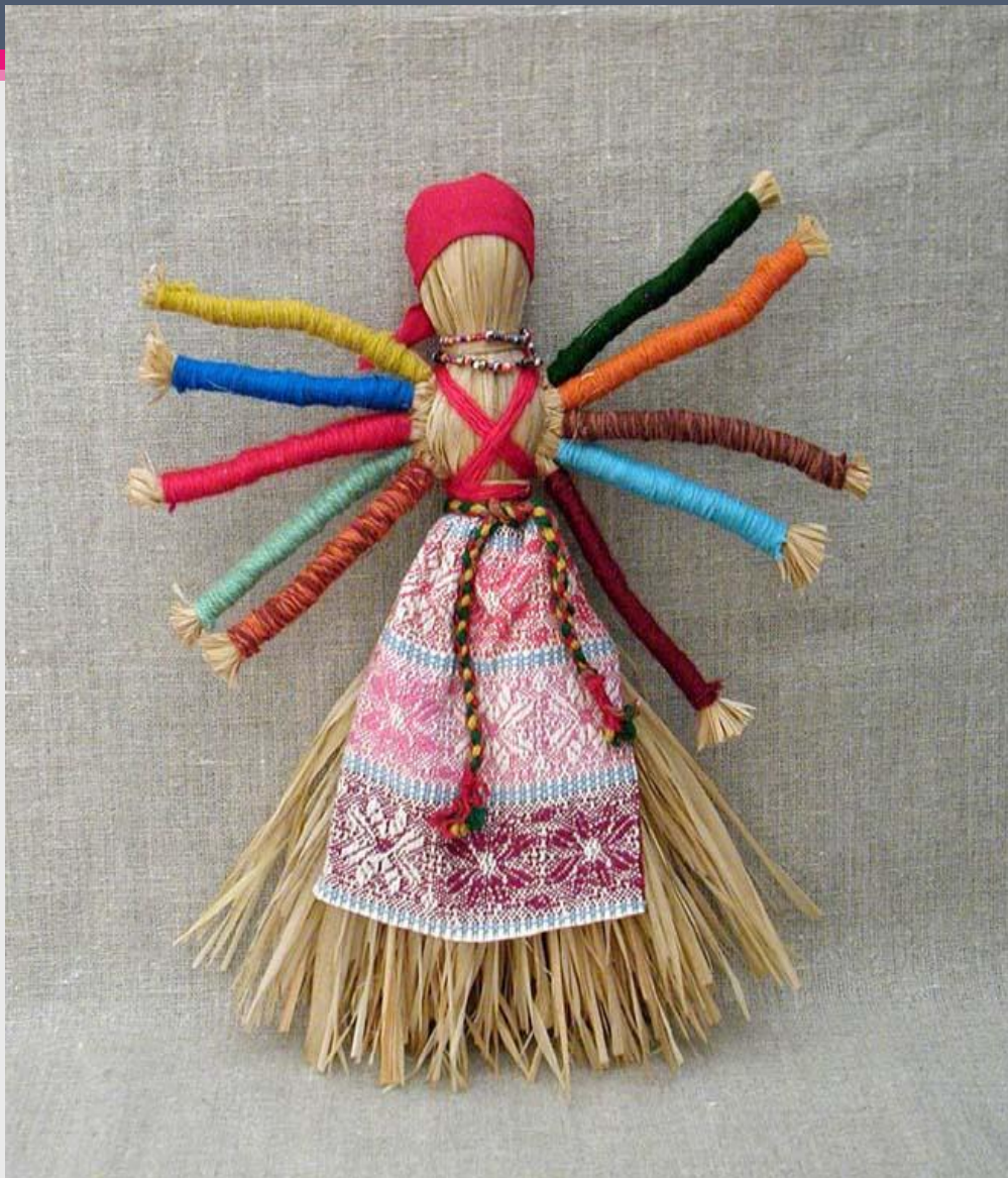
Кукла - десятиручка