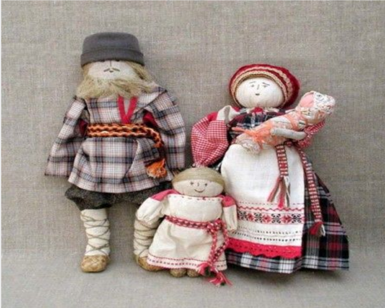
Русская игровая кукла.