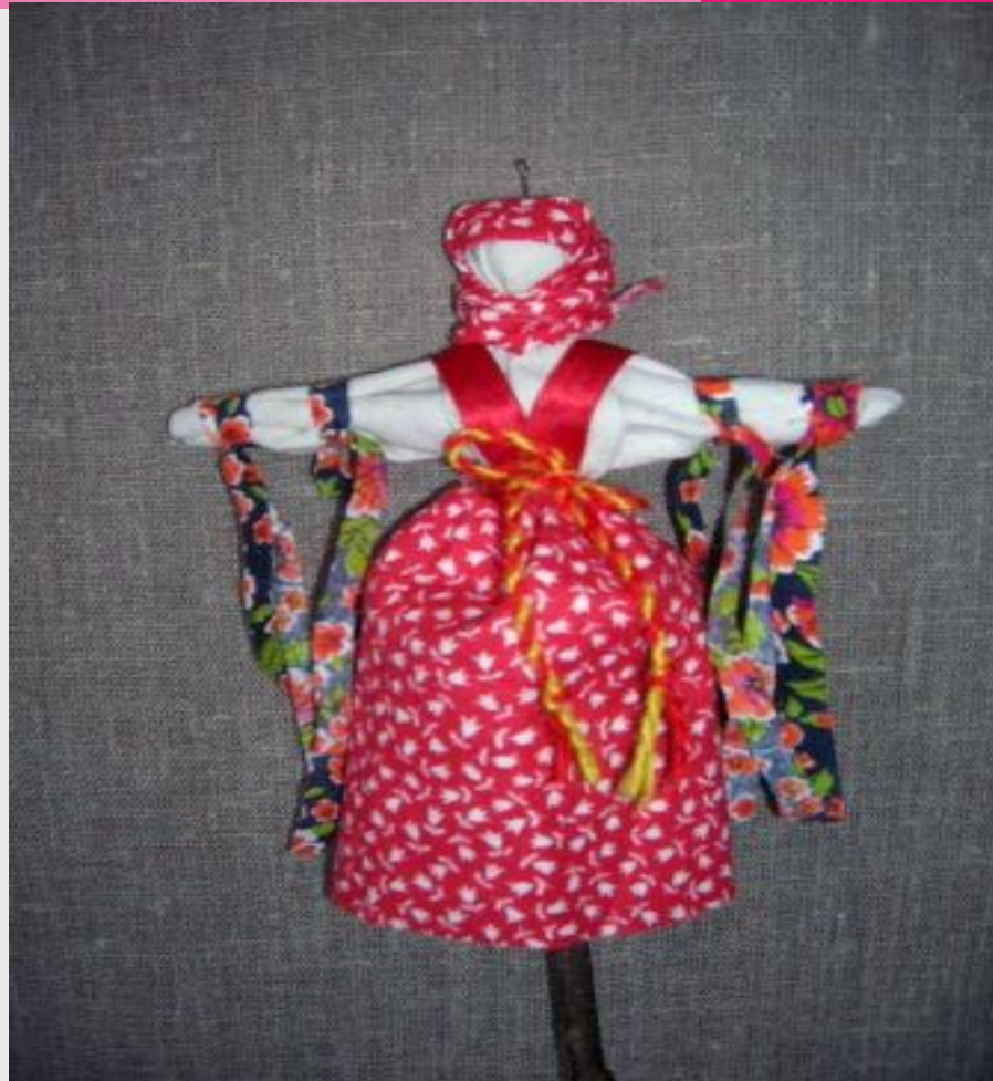
Купавка. Кукла одного дня. Уносит все беды и несчастья.