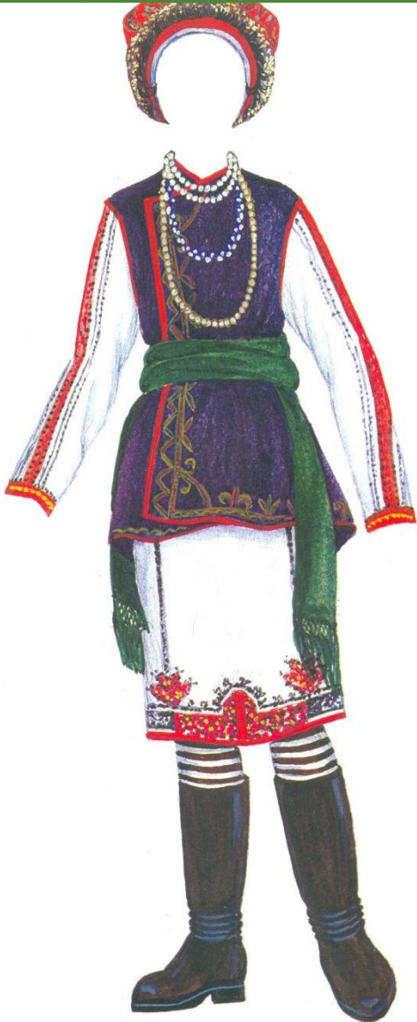
← Костюм невесты-мокшанки