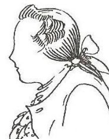
Парик «крысиный хвост». XVIII в.