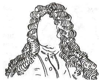
Парик «львиная грива». XVIII в.