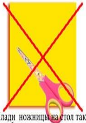
Клади ножницы на стол так, чтобы они не свешивались за край стола.