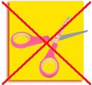
Не оставляй ножницы в открытом виде.