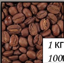
Робуста Индия Черри АА