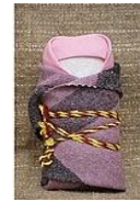
Кукла из СОЛОМЫ