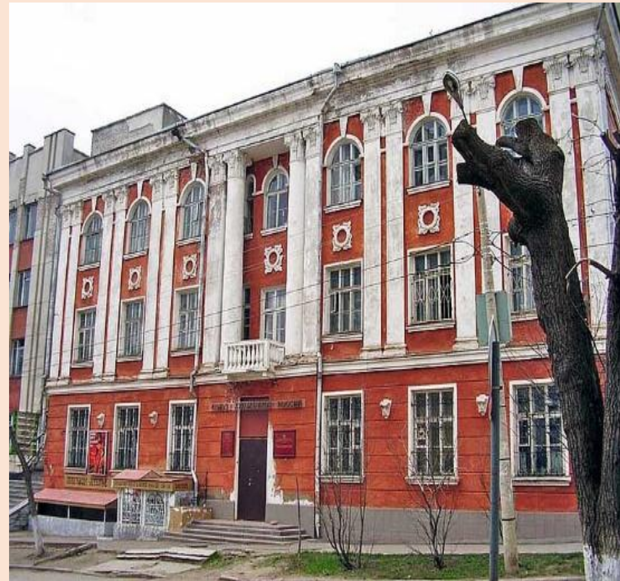
Россия, Киров, Ленинский район, улица Свободы, 67