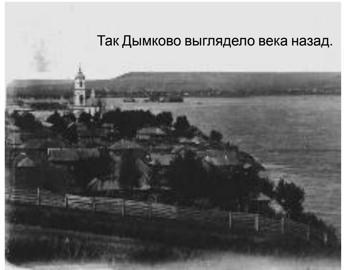
Так Дымково выглядело века назад.

Изготовление глиняных игрушек было семейным ремеслом. Глину добывали на берегу реки Вятки, смешивали с речным песком. с осени по весну занимались лепкой, сушкой и обжигом своих творений. готовые игрушки белили мелом, который разводили снятым коровьим молоком, после чего окрашивали яичными красками, украшая пятнами золотистой потали.