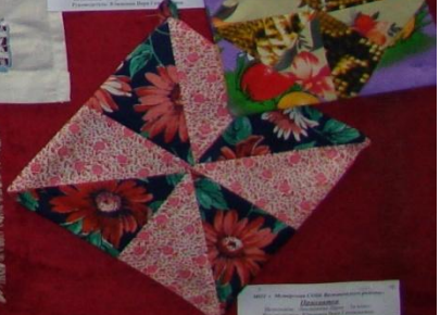
Мастерская 1000 Дарьяна Ширяева