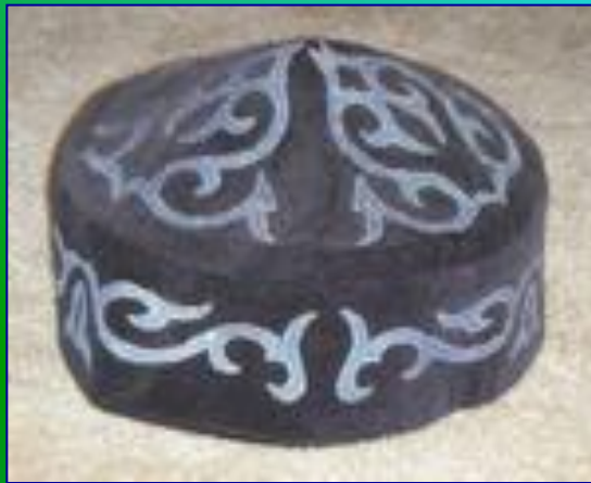
Казахская тубетейка – топы