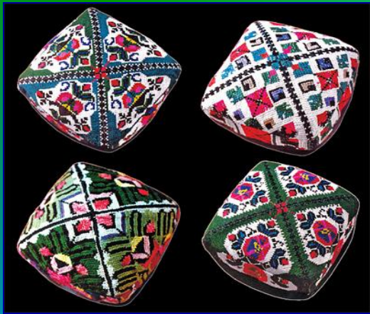
Узбекская тубетейка - дуппи или калпок.