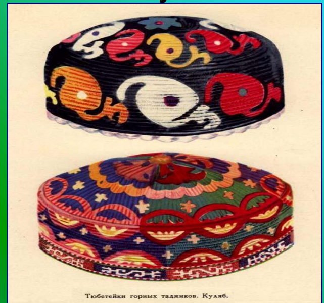
Тубетейки горных таджиков. Куляб.