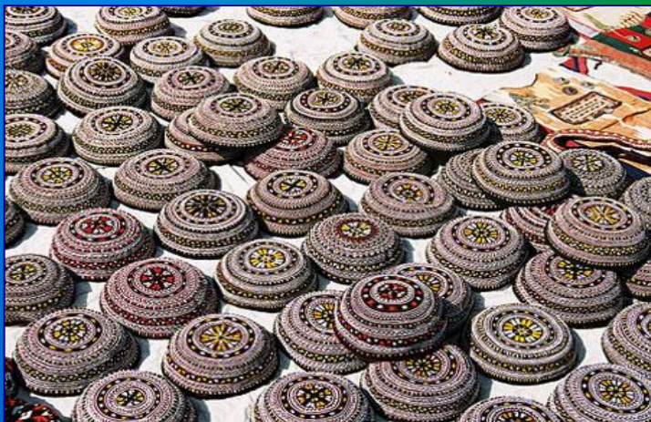
Туркменская тубетейка – тахья.