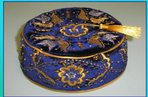
Татарская тубетейка - калыпуш.